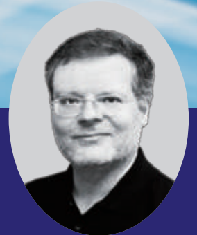
ピアノ ヴォルフラム・コロセウス マインツ音楽大学教授・元同大学学長

1955年生まれ。19歳で渡欧。ウィーンにて、W.バリリ、R.オドンボソフ、ロンドンにてN.プライニン、N.ミルシュタインの各氏に師事。1980年から19年間にわたり、ドイツのマンハイム国立劇場管弦楽団コンサートマスター。 2015年より松江クラシックス音楽祭音楽監督。聖書と、アウグスティヌス及びケルケゴールの著作を愛読。